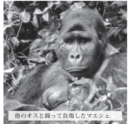
他のオスと闘って負傷したマエシエ