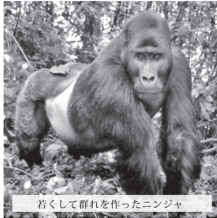
若くして群れを作ったニンジャ