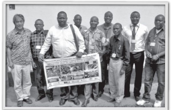
ポポフのスタッフとともに