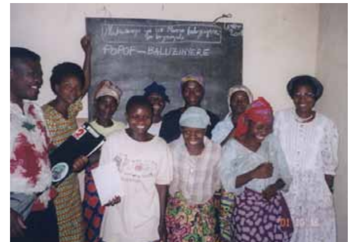
洋裁教室に参加した女性たち

この夏は、ポポフのアンガ環境学級の生徒たちに木工を教え、ポポフグッズを制作してもらいました。なかなかの出来栄で、これを販売して学資の支援や教材の購入に当てる計画です。ポポフグッズを通じて、ゴリラばかりでなく、ゴリラとともに生きる人々の暮らしを紹介し、その気持ちを伝えられればいいなと思っています。