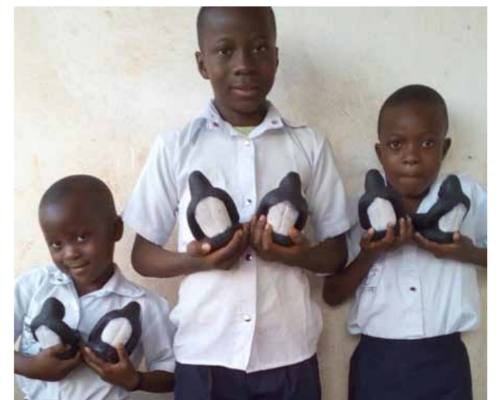
ポポフグッズ制作に挑戦した子どもたち

ポレポレ基金日本支部のウェブサイトから グッズを購入することができます。 http://popof-japan.com/blog/?page_id=24