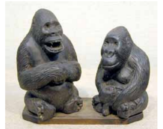
ポポフのアーティストが制作した夫婦ゴリラの彫刻

次に制作したのはウシの角を使ったペンダントやキーホルダーです。ポポフの地元ではアンコーレウシというとても大きく大きな角をしたウシがいます。食料としても、結婚のときに新郎が新婦の親に払う婚資としても重要で、ウシを増やすことが住民たちの目標でした。しかし、内戦の中で家畜は兵士たちに没収されてことごとく消費されてしまいました。残ったのは角だけです。そこで、角を削ってゴリラの姿を彫り、それにビーズをつけて素敵な飾りにしました。メッセージは「私たちに残されたのはウシの角だけだが、いつかウシそのものがもどってくるのを期待している」ということです。これは日本でも人気のグッズとなりました。今でも販売しています。