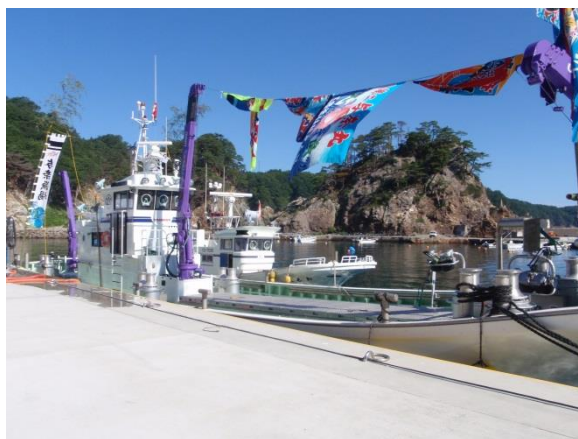
(重茂漁業協同組合が開催した「おもえ味まつり」2012年8月)