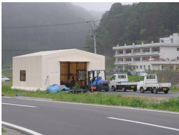
(十三浜 震災後、NPO 法人パルシックの支援で建設された共同加工施設 2012年8月)