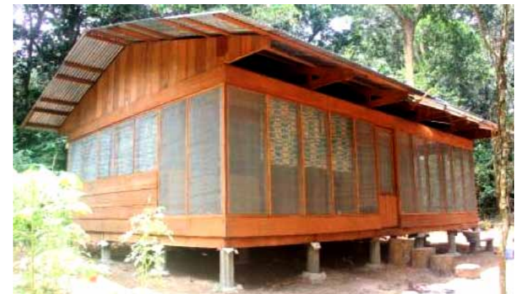
写真3：モンディカ・キャンプ地における先住民ガイド用の新しい建造物

前回の報告書でも述べたように、修繕と拡大の必要であった先住民ガイドの住居用小屋が新たに完成されました(写真3)。現在、キング、ブカに続く第三のグループの人付け作業を開始するためのさらなる人数の先住民ガイドを配置しているところです。