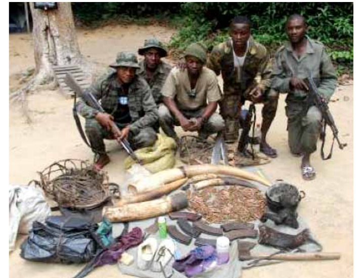
写真2：密猟者から押収したものを前にしたパトロールチーム

8月29日に、キング・グループの遊動域内で、自動小銃の銃声が聞かれました。翌日駆け付けたパトロール隊は、モンディカ・キャンプから2.5kmほどの距離の森の中で密猟者と遭遇しました。密猟者は逃げましたが、密猟者のキャンプから、350個ほどの自動小銃の銃弾、7つの銃弾装填具、二組の象牙、サル類とニシキヘビのブッシュミートなどが押収されました(写真2)。明らかに密猟者はこの地域で、象牙目的のゾウを密猟したわけですが。また9月21日には、ブカ・グループの遊動域内で、2カ月ほど前の密猟者の通過した痕跡が発見されました。