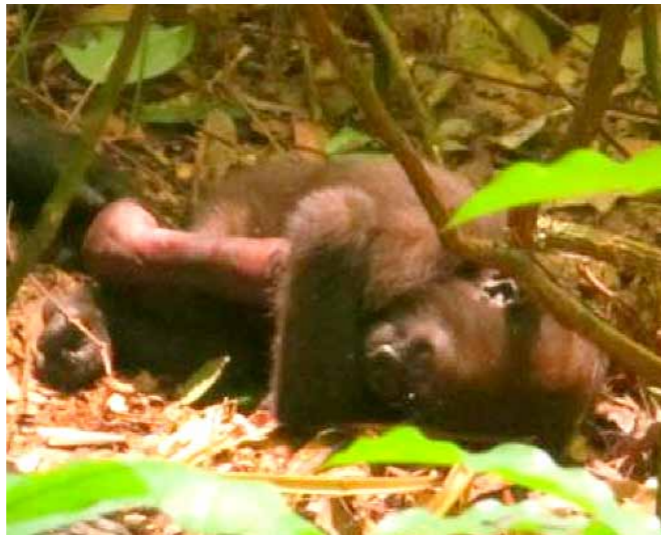
写真1：右腕を噛まれたブカグループのコードモゴリラ

両グループとも頭数は一頭ずつ少なくなり、それぞれ12頭、7頭になりました。キング・グループではオトナメス一頭が他のグループへ移動しました。9月1日頃のことでした。このオトナメスは1997年の人付け以来キング・グループに19年滞在したことになります。ブカ・グループでは、7月29日に近隣の他のゴリラのグループからの攻撃を受け、一頭のコードモゴリラが右腕を噛まれるという事件が起こりました(写真1)。8月2日にWCSの獣医のもと、腕の怪我の化膿などを防ぐ手立てはしましたが、8月4日には残念ながらこの個体は死亡しました。