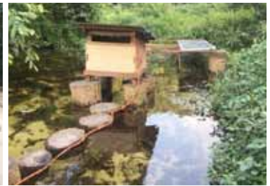
新たにモンディカ川に設置されたソーラーシステム