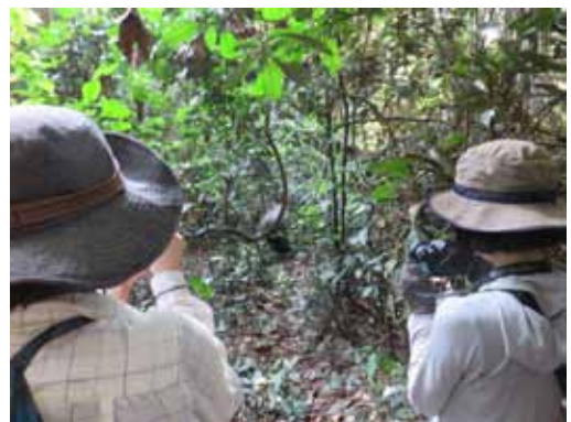
モンディカを訪問中の研修員二人

このようにクリック募金は、モンディカだけでなく、地球上最大のゴリラの頭数を誇るコンゴ共和国北部全体の野生のニシローランドゴリラとその生息地の保全・研究・教育活動、ツーリズムの進展に大きく貢献し続けていきます。今後とも、ご支援をよろしくお願いいたします。