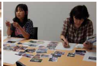
フォトブック作成へ向けた初日の講義（左上）、写真を選択しメッセージを作る二日目の作業（右）、完成して印刷されたフォトブック（左下）