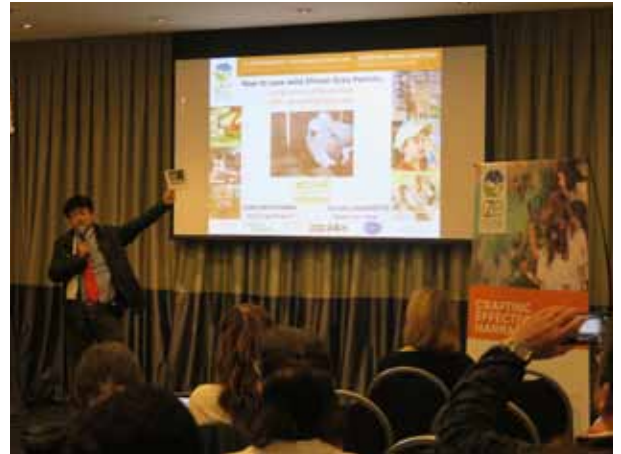
IZEで口頭発表する筆者

今後、このフォトブックに関しては、筆者は、同様の要領でゾウや類人猿など様々な野生生物やFSCなどの認証制度普及のための保全教育ツールを展開していく計画です。