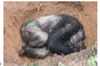
埋葬される前の死亡した大人オスのゴリラ

10月初旬、調査地域内で、一頭で遊動している大人オスが地上でうずくまっているのが発見されました。手と膝にひどい傷を負っていたところから、この個体は樹上から落ちたものと研究者は判断、観察を続けましたが、10月5日には健康状態は悪化し、死亡が確認されました。死体は、モンディカ・スタッフにより埋葬されました。