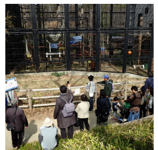
写真：ワイルドライフカレッジ 2024での活動